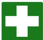
CASSETTA DI PRIMO SOCCORSO