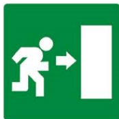
USCITA DI EMERGENZA