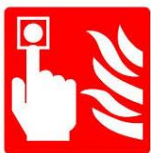
PULSANTE DI ALLARME