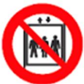
NON ADOPERARE GLI ASCENSORI IN CASO DI INCENDIO