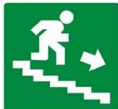
SCALA DI EMERGENZA